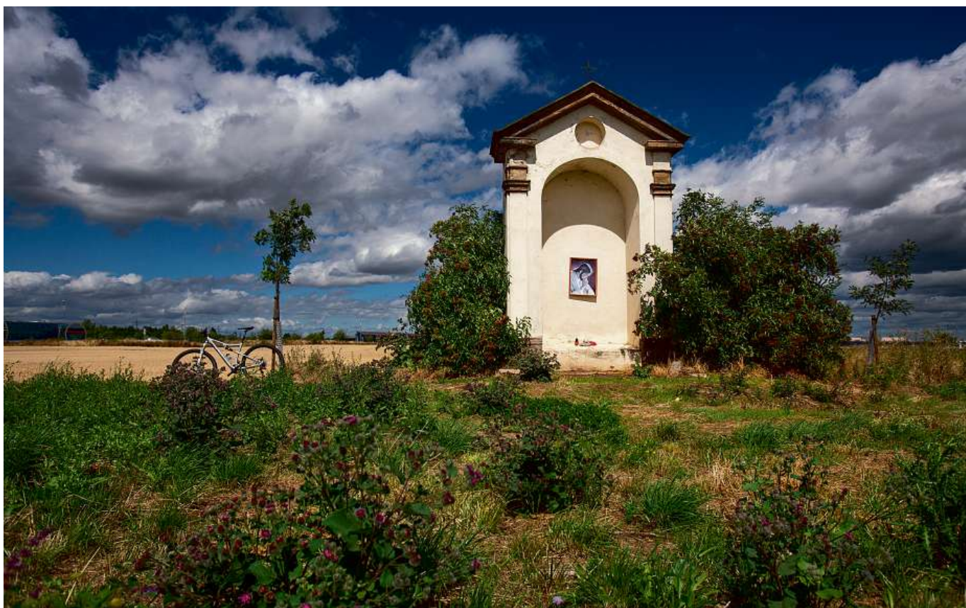
Kaplička u cesty. Skrze Kbelky vedla historická poutní cesta z Prahy do Staré Boleslavi a byla osazena 44 kapličkami, do dnešní doby se zachovala polovina. Kapličky byly vyzdobeny obrazy vyjadřujícími výjev ze života sv. Václava a v menší horní části byla zobrazena socha Madony nebo poutní obraz, podle kterého byla daná kaple pojmenovaná a které byla kaple zasvěcena.

Kdo by chtěl prozkoumat okolí, může se vydat inline stezkou do přilehlých Letňan, které také disponují lesoparkem, případně se vydat opačným směrem. Za Kbelskou ulicí se rozprostírají idylické Klíčovské sady, kde si na podzim zcela bez obav můžete natrhat jablek i hrušek, co hrdlo ráčí. Jedná se totiž o veřejné sady a jejich součástí je i historicky první